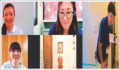
トップワークスの住まいのこと オンライン相談窓口

また、お家に長く居るからこそリフォームしたいと思われる方もいらっしゃるかもしれません。けれど直接会って打合せする事に不安がありなかなか相談ができない、といった状況が続いたことから、オンラインでお家を拝見させていただきながらお問合せ内容伺い、お見積りをご用意できる環境